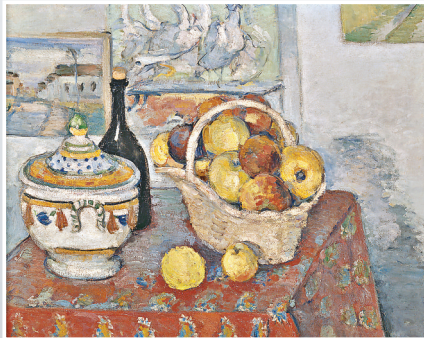
■「塞尚和雷諾阿的世界」珍藏展