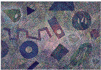
■ Howardena Pindell 的噴漆繪畫。

美國藝術家 Howardena Pindell 由即日起至1月8日，首次於香港舉辦個展「Deep Sea, Deep Space」，這亦是她在亞洲的首次展出一系列啟發自海洋與太空景觀的噴漆繪畫及以打孔器創作的混合媒介作品。展覽包括《Tesseract》系列，以及受太陽系和海洋啟發的新畫作。藝術家運用獨特的噴漆技術繪出無數圓點並組成畫作。這些原點源自於她童年時對種族隔離制度——吉姆·克勞法的記憶，她透過作品探討種族主義和性別不平等社會議題。 地址：上環干諾道中50號白立方