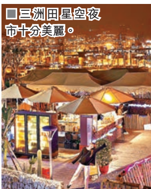
■三洲田星空夜市十分美麗。