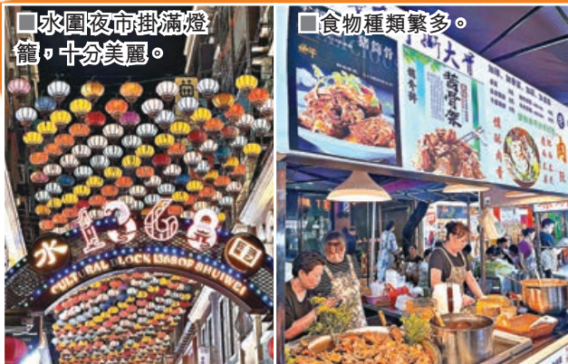
■水圍夜市掛滿燈籠，十分美麗。