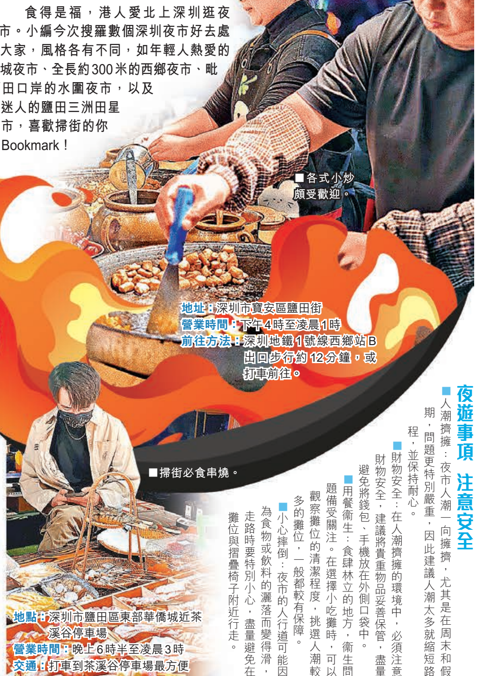
■各式小炒頗受歡迎。

食得是福，港人愛北上深圳逛夜市。小編今次搜羅數個深圳夜市好去處給大家，風格各有不同，如年輕人熱愛的古玩城夜市、全長約300米的西鄉夜市、毗鄰福田口岸的水圍夜市，以及浪漫迷人的鹽田三洲田星空夜市，喜歡掃街的你記得Bookmark！