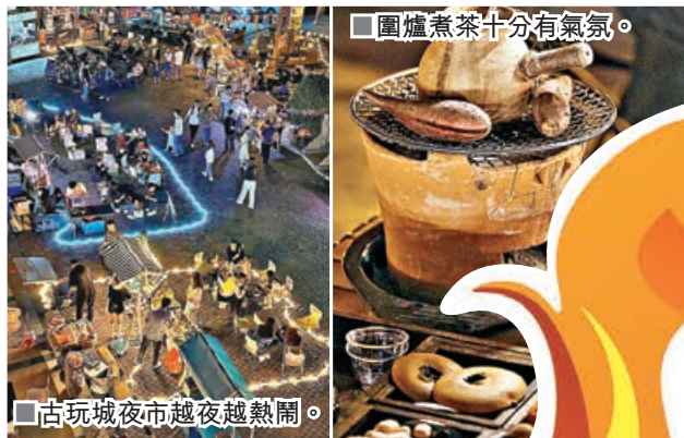
■圍爐煮茶十分有氣氛。