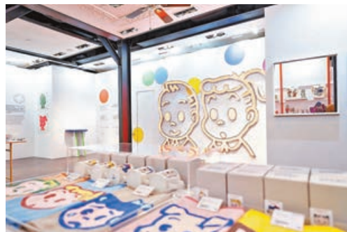
■以繽紛色彩圓點為核心設計元素。

本地潮流玩具平台KKPLUS與日本國寶級可愛始祖原田治 OSAMU GOODS，首度攜手帶來「原田治 OSAMU GOODS go to HONG KONG」期間限定店。原田治 OSAMU GOODS 今次來到香港，把活動選址於尖沙咀的1881Heritage，當這個逾130年歷史的香港法定古蹟遇上日本國寶級的原田治 OSAMU GOODS，必定會擦出火花。除了透過是次活動令更多人認識原田治 OSAMU GOODS 獨特的可愛文化，KKPLUS還特意搜羅超過200款獨家產品，以及專為香港期間限定店設計的地區限定周邊產品，同時更提供一系列特別會場