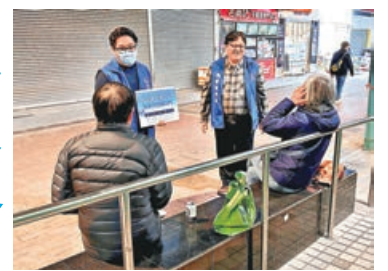
鴨洲北關愛隊巡視社區，提醒居民做好禦寒。

今年第一個寒鋒襲港。香港天文台表示，一股強烈冬季季候風會在今晚抵達華南沿岸，周五（10日）及周末氣溫驟降，早晚寒冷，市區最低氣溫跌至11、12度左右，新界部分地區及高地嚴寒。周六（11日）氣溫進一步下降，預料將軍澳及香港仔上午僅9度，打鼓嶺低見6度。全港各區關愛隊及社區組織未雨綢繆，昨日已出動派發禦寒物資，以及呼籲獨居長者注意溫度驟降，為弱勢社群送上暖流。