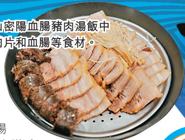
■釜山密陽血腸豬肉湯飯中的豬肉片和血腸等食材。

海雲台市場的入口就在海水浴場與地鐵站中間，市場的街道裏頭有許多海產店、小食店可以覓食。例如可以吃到韓國釜山國民美食豬肉湯飯，著名的密陽血腸豬肉湯飯就在附近海雲台地鐵站出口大約3分鐘，地點相當好找。密陽血腸豬肉飯的湯頭很香醇，把韭菜、蝦醬都放進去比較好吃。另外可再點一個單人份的薯仔排骨湯，包你吃光光。