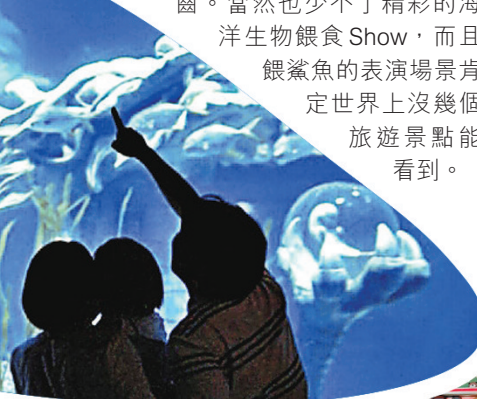
■SEA LIFE水族館好大條虎鯊呀！

SEA LIFE釜山水族館就在海雲台海水浴場裏面，在沙灘上就能看到入口的建築，雖然小小的，但設計的頗繽紛歡樂，最厲害的是這裏養了好幾條虎鯊，可以近距離看到鯊魚嚇人的牙齒。當然也少不了精彩的海洋生物餵食Show，而且餵鯊魚的表演場景肯定世界上沒幾個旅遊景點能看到。