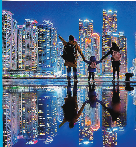
■The Bay 101 晚上可拍出的倒影美照。