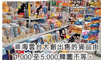
■海雲台大創出售的貨品由1,000至5,000韓圓不等。