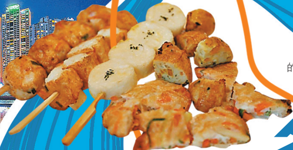
■魚糕是海雲台的超人氣美食。

The Bay 101是海雲台超級熱門Iq打卡地標，白天很普通，但一到晚上就華麗變身，周邊還有好幾間咖啡店，點杯咖啡坐下來欣賞夜景相當棒。另外網絡上瘋傳的那種倒影照片，其實是利用在地上灑水來拍攝的效果，除非剛好下雨，否則就要自己帶一大瓶礦泉水來，或者付費請現場專門幫人家拍照的攝影師來照相。