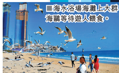
■海水浴場海灘上大批海鷗等待遊人餵食。

朝着海雲台海水浴場的方向走，會見到一個又美又乾淨又有超多海鷗聚集的海灘，是不可也不會錯過的浪漫景點。如果想要和海鷗來場親密接觸，記得隨便找家便利店買包蝦味之類的餅乾，餵餵海鷗吧！