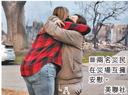
■兩名災民在災場互擁安慰。