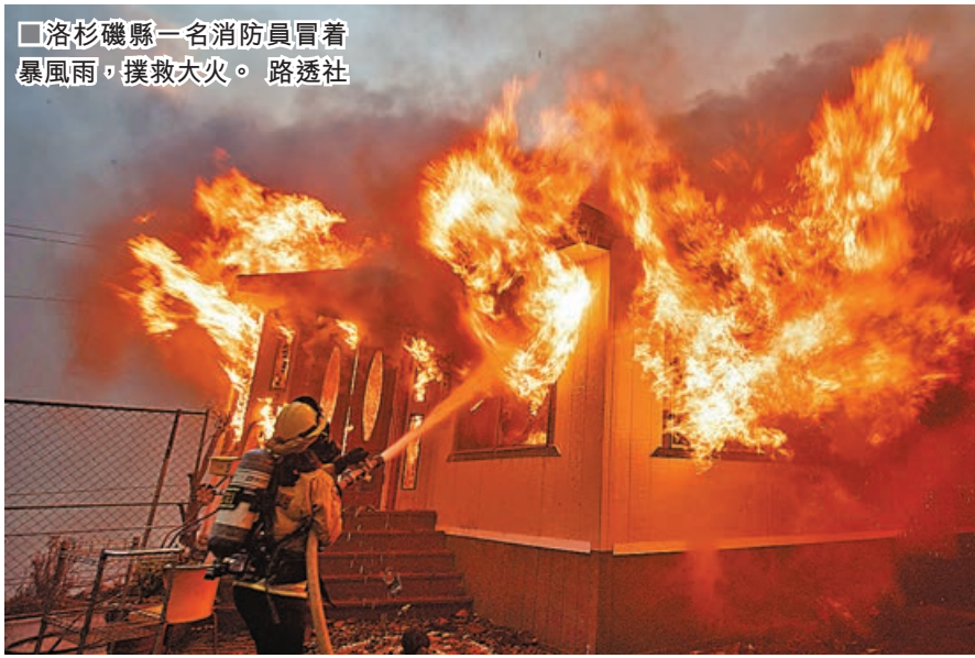
■洛杉磯縣一名消防員冒着暴風雨，撲救大火。

月17日公布入圍名單，但由於山火肆虐，投票截止時間被推遲兩天至1月14日，而入圍名單公布亦推遲至19日。