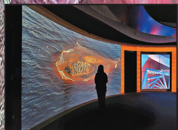
■《Refuges》反映動物在氣候變化中流離失所。

創科體驗館的10個展區、逾300科技組件將帶來升級的互動體驗，展現科技園及園區公司的卓越科研與成就，同時強調平衡創科發展與環境管理的重要性。訪客可以體驗由 Reunite Limited 製作的「人工智能手術儀器核算大挑戰」，了解醫院如何利用人工智能解決問題，認識科技園公司與各界的合作項目。科技園公司正積極引領業界應對氣候議題，推動綠色科技，承諾在2045年前達到「科學基礎減量目標倡議(SBTi)」提出的淨零排放標準。