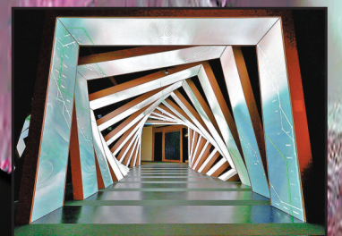
■《棲息》強調香港對候鳥的重要性。