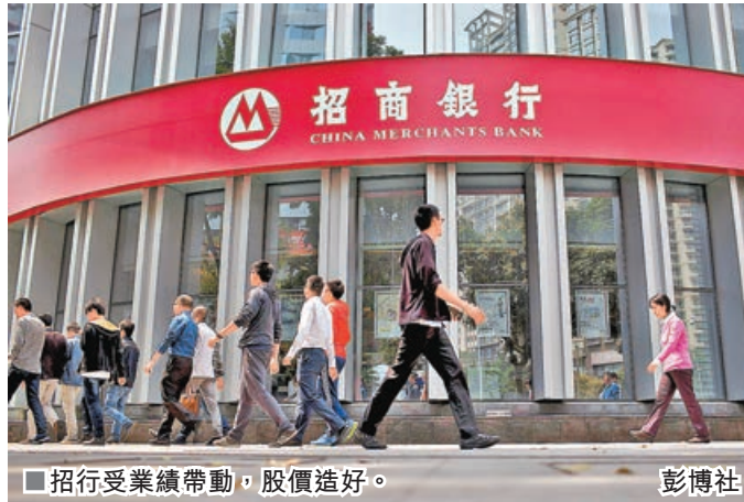
招行受業績帶動，股價造好。

港股日內波幅不足 200 點，總體謹慎觀望氛圍未能消散；然而，美元指數衝高至 110 的逾兩年半新高後終於回軟，相信可紓緩近期緊繃氣氛。內地明天公布最新 GDP 數據，而特朗普亦於下周就任美國總統，估計都是市場關注點。恒指連升第 2 日，昨再升逾 60 點，以接近 19,300 點收盤。