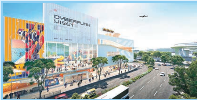
■ 項目包括新鮮食品空運市集及藝術倉庫。