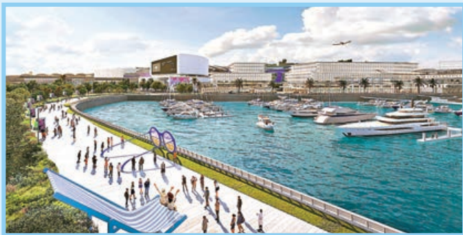
■ 機場海灣碼頭將提供逾500個遊艇泊位。