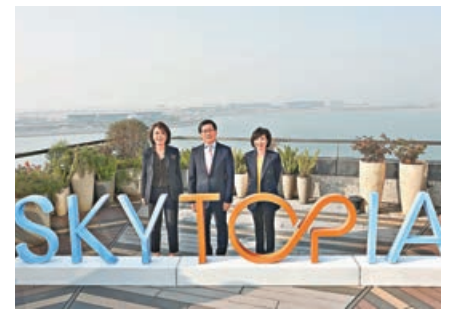
■ 機場城市項目料涉千億元。 機管局

成為一個具有地標意義的地方，以及全球領先的目的地，吸引來自香港、大灣區內地城市、亞洲及世界各地的旅客。