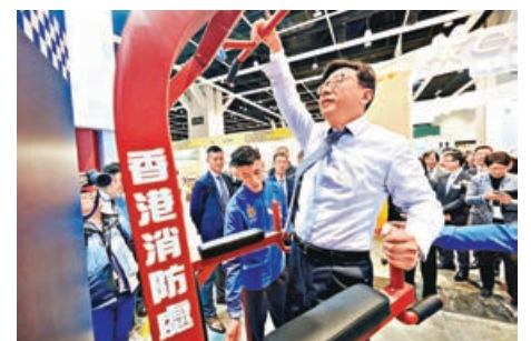
■ 勞福局局長孫玉菡在消防處攤位進行體能測驗。

推動職專教育的職訓局，今年特設職專畢業生留港計劃（VPAS）攤位，供非本地學生了解完成學業後留港、投身本地相關技術行業的發展前景，助力香港建立優質人才庫。港大修讀文學士二年級的周同學表示，想多了解例如大灣區內其他城市的升學及就業機會，「展覽中見到有故宮和敦煌等博物館的暑期實習計劃，非常吸引，現場工作人員很細