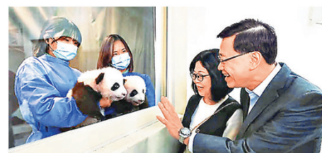
李家超早前到海洋公園，探訪大熊貓龍鳳胎。

李家超亦在社交媒體發文指出，與太太林麗焯早前曾到海洋公園，探訪兩隻大熊貓龍鳳胎寶寶，他們又聽取就龍鳳胎健康狀況的評估和匯報，很高興得知龍鳳胎正健康成長。