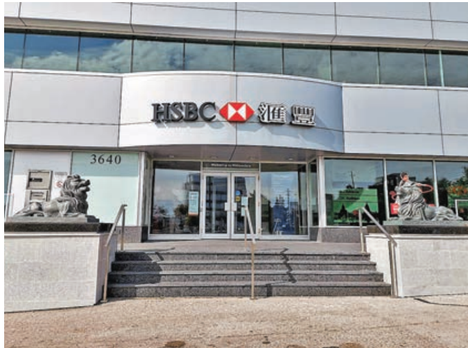
■ 滙控繼續是護盤主力。

港股繼續造好，恒指進一步站上20,000點水平收盤，是今年來首次。臨近農曆新年，估計市況保持維穩狀態。特朗普宣誓就任美國總統，上任首日未有提及對華徵收關稅事項，反而簽署行政命令，延後對TikTok實施禁令，市場憧憬中美關係有機會修復，提振市場氣氛。此外，人民幣兌美元近日明顯走強，回升至1個月以來高位，也增強投資者信心。