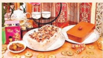
■ 櫻花蝦臘味蘿蔔糕及沖繩黑糖椰汁年糕。

歷山酒店則推出櫻花蝦臘味蘿蔔糕和沖繩黑糖椰汁年糕。櫻花蝦臘味蘿蔔糕黃金比例手切蘿蔔絲，混和切粒炒香的臘腸、櫻花蝦及蝦米製成年糕，口感層次豐富，更可配以酒店自家製的至尊鮑魚XO醬，惹味