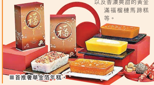
■ 首推奢華金箔年糕。

8度海逸酒店推出全新自家製鹹甜精緻賀年糕點，包括創新口味的金箔椰汁年糕，連一向大受歡迎的如意瑤柱臘味蘿蔔糕、滋補養顏的金箔燕窩桂花糕，以及香濃爽甜的黃金滿福榴槤馬蹄糕等。