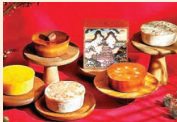
■ 一系列精緻賀年食品。

九龍香格里拉推出由米芝蓮星級香宮中菜團隊製作的一系列精緻賀年食品，包括9款賀年糕點、應節禮物籃及小食。賀年糕點除了馬蹄糕、蘿蔔糕和芋頭糕等傳統風味外，酒店亦推出多項創新款式年糕，包括港人近年最愛的開心果口味。開心果年糕結合了傳統年糕的口感，且加入開心果的香濃味道，夠晒特別。