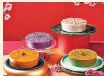
■ 君綽軒推出的年糕禮盒。

港島海逸君綽酒店君綽軒今年推出5款賀年糕點，分別是金華火腿臘味蘿蔔糕、羊肚菌芋頭糕、30年陳皮椰汁增城黑糖年糕、金箔薑汁紫薯糕以及開心果年糕，有鹹有甜，滿足大家不同口味。各款自家製年糕均不含防腐劑，食得更放心。