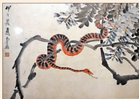
■《端陽圖冊》描繪紅黑相間的蛇。