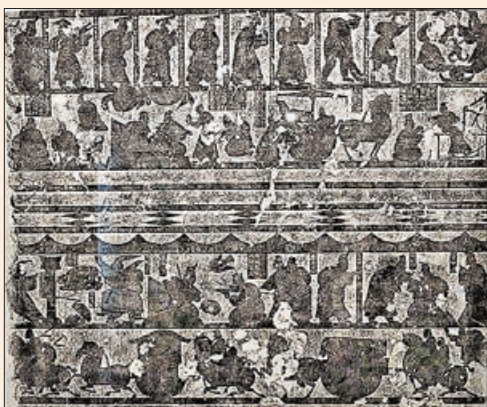
■「山東嘉祥武梁祠畫像石拓片」。

這種蛇身神形象在漢代廣為流行，又見諸各地畫像石。在展出的另一幅「重慶江北區盤溪蘇家院子磚室墓畫像石拓片」中，女媧和伏羲則分別手握排簫和波浪鼓，相傳二人是人類音樂的始祖。