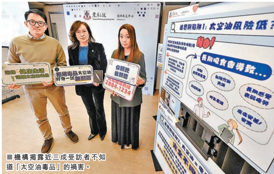
■機構揭露近三成受訪者不知道「太空油毒品」的禍害。

俗稱「太空油」的新興毒品「依托咪酯」(Etomidate)自去年開始在港出現並迅速流行，吸食的年輕人數目劇增。東華三院越峰成長中心公布一項調查顯示，發現近半數受訪市民誤解「太空油毒品」的主要成分為尼古丁，近30%受訪者更不清楚「太空油毒品」的禍害。中心並在526個跟進的個案中，發現66人有吸食「太空油毒品」，年紀最小的只得12歲。中心建議社會加強教育及宣傳，提升公眾，特別是青少年對「太空油毒品」的認知。