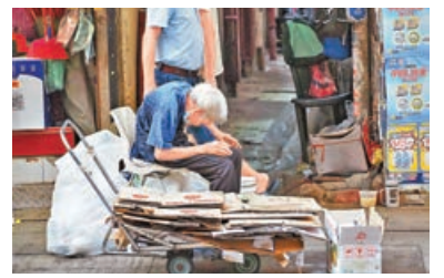
■不少長者領取長生津。

識，同時糾正他們對「太空油毒品」的謬誤。家庭、學校和社會亦應加強關注年輕人的精神健康，並適時提供支援，及早協助子女正面處理壓力。