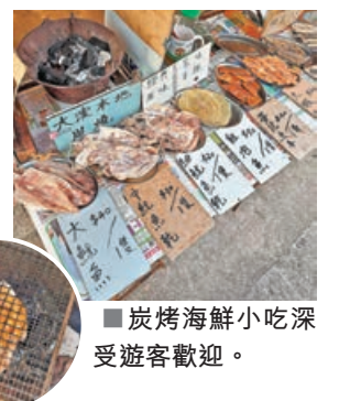
■ 炭烤海鮮小吃深受遊客歡迎。

炭烤魷魚：炭烤魷魚是一個隱藏美食，原隻魷魚乾經過炭火烘烤後，激發出香氣四溢，塗上秘製醬汁後再剪成小塊食用，初嘗或許會覺得有些硬梆梆乾噎噎，但細品之後便會越嚼越香，俘獲食客芳心。炭烤海鮮小吃攤上亦會售賣烤蝦乾、魚乾等，遊客可以根據喜好選擇。