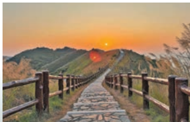
■ 在虎山觀景台可以看 到絕美日落。