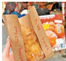
■ 沙翁是大澳的特色美食。