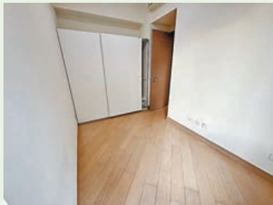
房間可放得落大型衣櫃。