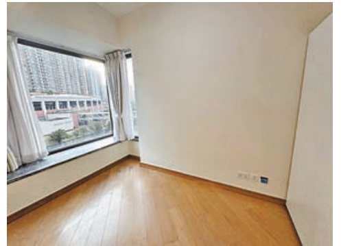
房間設有玻璃大窗台。