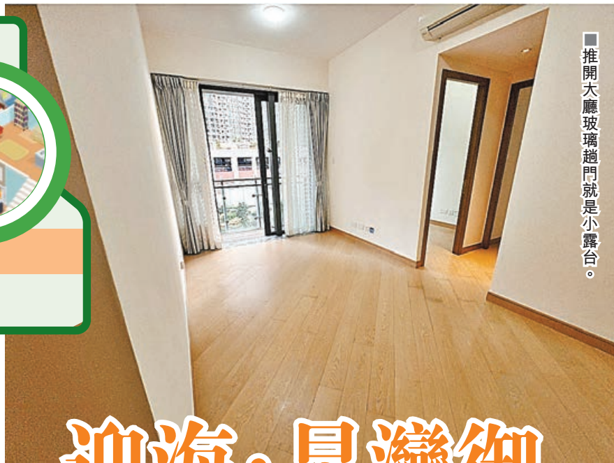
推開大廳玻璃趟門就是小露台。