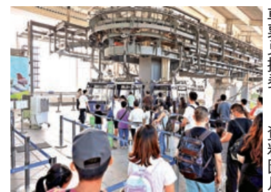
■有無牌小販售賣昂貴車票兌換券。

展望未來，東區醫院希望進一步提升機械人輔助手術的設備至第五代，即單孔微創手術機械人系統。東區醫院外科部門主管李卓文稱，現時單孔機械人系統以美國水平最高，至於內地、韓國等多個地區亦有研發，「未來要看醫管局決定，不管國產還是美國，能幫到病人都歡迎。」