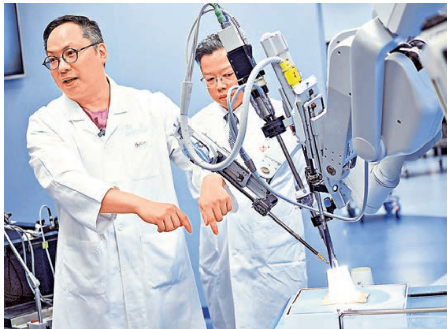
■團隊講解以機械人輔助進行複雜手術。

系統進行的手術創口較小，術後外觀更為美觀。同時運用該系統輔助的微創手術，術後8至10天即可出院，較傳統微創手術要兩周才出院，縮短了住院天數和康復時間。