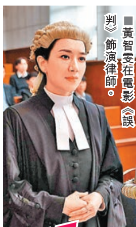
■黃智雯在電影《誤判》飾演律師。