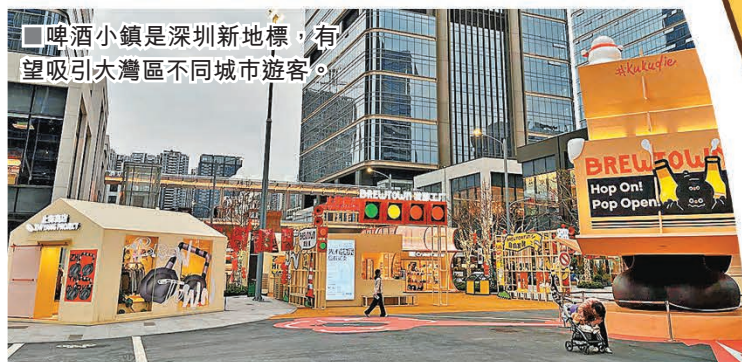
啤酒小鎮是深圳新地標，有望吸引大灣區不同城市遊客。

其他餐飲方面，除了港客熟悉的綠茶餐廳、馮校長老火鍋，亦有喜茶、霸王茶姬等耳熟能詳的茶飲選擇；B1商業街是美食與潮玩聚集地，各類小吃、輕餐飲、粉麵美食香氣四溢，讓遊客垂涎欲滴。此外，靠近地鐵站B出口的区域，還有酷樂潮玩、華為、小米等潮玩及數碼科技店，亦有深圳首家X Party概念店星聚會KTV，給遊客提供沉浸式娛樂享受。值得一提，啤酒小鎮除了提供不同玩樂體驗，還有啤酒博物館、精釀工廠參觀試飲、博物館廣場歷史遺蹟打卡等，將陸續向公眾開放，給一眾北上港客獨特又夠Chill的新玩法。