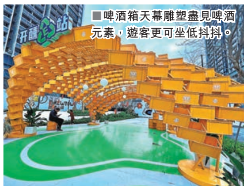
啤酒箱天幕雕塑盡見啤酒元素，遊客更可坐低抖抖。