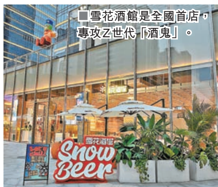
雪花酒館是全國首店，專攻Z世代「酒鬼」。

啤酒小鎮位於寶安區新安街道的尖岡山核心區域，乘搭深圳地鐵5號線至興東站B出口，沿商場步行約300米即可到達。小鎮原址是深圳金威啤酒廠的一部分，保留發酵罐遺址，現改建為以啤酒為主題的開放式街區商業項目，是由華潤置地、華潤啤酒聯合投資，華潤萬象生活營運，打造出近5萬平方米的休閒生活空間，以「休閒街區、獨棟庭院、三大戶外廣場」建築場景，集合不同餐飲、玩樂、休閒商舖及超時尚打卡熱點。