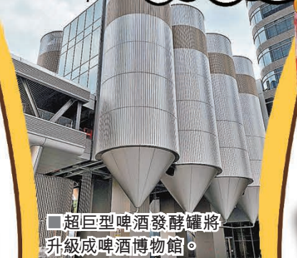
超巨型啤酒發酵罐將升級成啤酒博物館。