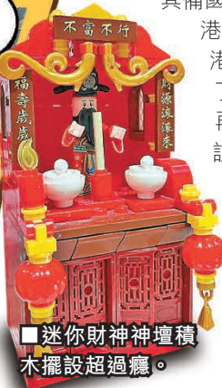
迷你財神神壇積木擺設超過癮。