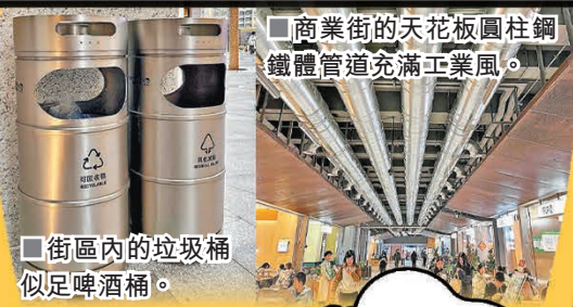
商業街的天花板圓柱鋼鐵管道充滿工業風。