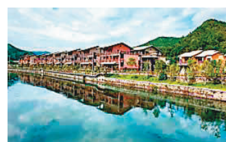
九連山溫泉度假山莊

酒店農家早餐－自由享受溫泉－午餐廣式魚子醬片皮鴨－客家文化公園－乘坐旅遊巴回程送返指定口岸解散