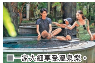
一家大細享受溫泉樂。