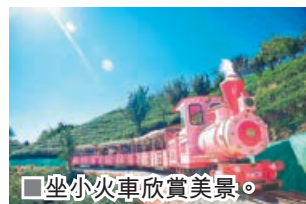
坐小火車欣賞美景。