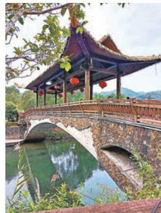
山莊回歸大自然的設計理念。