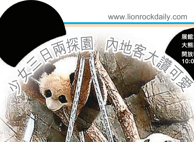
■姐弟精力充沛，打打鬧鬧冇時停。