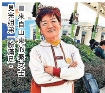
■來自山東的秦女士見完姐弟三臉滿足。