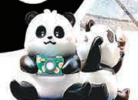
■家姐刷到天昏地暗，萌度爆燈。