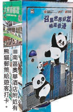
■南區奧華酒店附近有熊貓郵筒給遊客打卡。