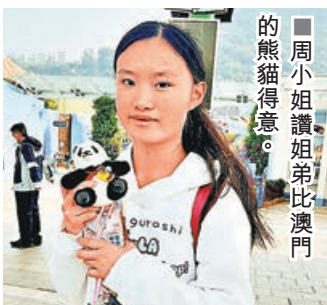
■周小姐讚姐弟比澳門的熊貓得意。

各位離園後，其實仍可繼續「熊」圖大展，港鐵海洋公園站已成無處不熊貓的「熊貓主題車站」，6隻大熊貓盈盈、樂樂、家姐、細佬等遍布車站不同角落，包括客務中心、月台、樓梯及天橋；南港島線亦有熊貓主題列車，大家可輕鬆沾「熊」氣。隨後，各位可乘港鐵到黃竹坑站商場THE SOUTHSIDE，場內有多個可愛熊貓裝置在不同樓層，正門戶外放置了高達4米的熊貓藝術裝置，活潑趣致的一對熊貓注入活力，大家亦可到Citysuper購買熊貓造型吉士包醫肚，肯定「熊」運當頭，為這個「熊」足一日的旅程寫上完美句號。值得一提，各位如果怕早起，可預訂附近奧華南區酒店，截至昨日價格，若預訂下周二入住2人房不用1,000元，由酒店步行往海洋公園僅5分鐘，方便更早到園區排隊。