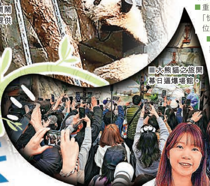
■大熊貓之旅開幕日逼爆場館。