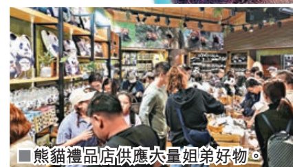
■熊貓禮品店供應大量姐弟好物。