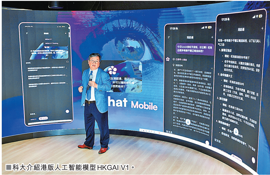
科大介紹港版人工智能模型 HKGAI V1。

內地人工智能 (AI) 大模型 DeepSeek 上月橫空出世衝擊全球，由香港科技大學領軍，聯合四所本港及一所海外頂尖大學的人工智能科學家組成的 InnoHK 香港生成式人工智能研發中心 (HKGAI) 團隊，在本地生成式 AI 研發基礎上，昨日正式發布全國首個基於 DeepSeek 全參數微調，並持續訓練產生的大模型 HKGAI V1。系統支援兩文三語，工作人員昨日以火熱電影《哪吒2》為題，要求系統利用詞牌《水調歌頭》作詞一首，凸顯其文學創作能力。