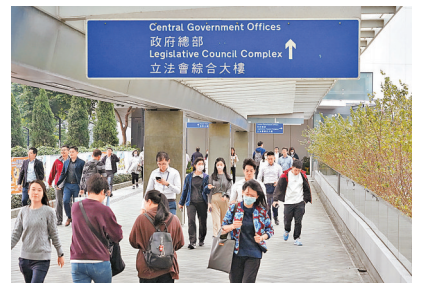
財赤下公務員或要凍薪。

至於2元乘車方面，消息指政府傾向60歲享優惠門檻不變，但會改為每月限最多240次優惠，即平均每日限搭約8次；10元以上票價則以兩折計算。