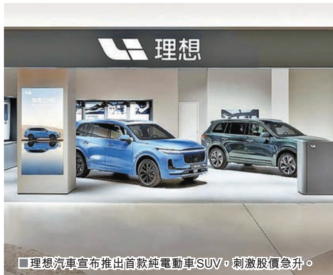
理想汽車宣布推出首款純電動車SUV，刺激股價急升。

受到隔晚中概股下跌影響，港股伸延震盪整理行情，然而，資金趁低吸納積極性未見減弱，尤其是港股通淨流入規模進一步增加至逾220億元。在資金持續流入情況下，相信有利港股盤面保持總體穩好狀態。恒指連跌兩日，昨再跌超過300點，但仍守在10天線22,726點之上，最終以23,000點水平收盤。大市交投維持暢旺，成交金額錄得近3,300億元，資金參與積極性保持良好。