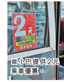
小巴提供2元乘車優惠。

政府消息人士指出，社會對2元乘車計劃的最大共識，是優惠次數不應有上限，及要處理「長車短搭」問題，徵詢方案回應訴求且盡量簡單易明。政府假設長者每日來回子女家幫手湊孫兩次，即使每次需轉車一次，每日亦是搭8程車，每月設240程上限仍未會超標，「當然或有長者喜歡周末行山，一日搭十幾程車到不同地方，但不會天天這樣。」 「兩蚊兩折」問題上，消息人士表示，全港近60%公共交通路線票價均在10元或以下，即使乘搭九巴968號線往來元朗及銅鑼灣，兩折後亦只需支付5.4元，已較原本成人票價省下21.6元。 被問到為何需時一年半調整系統推行兩蚊兩折，消息人士表示，是參考了去年實施樂悠咭實名制，八達通系統改動需要時間。由於預算案未公布前不能與八達通公司商討，故推行時間只屬估計，或可提前。