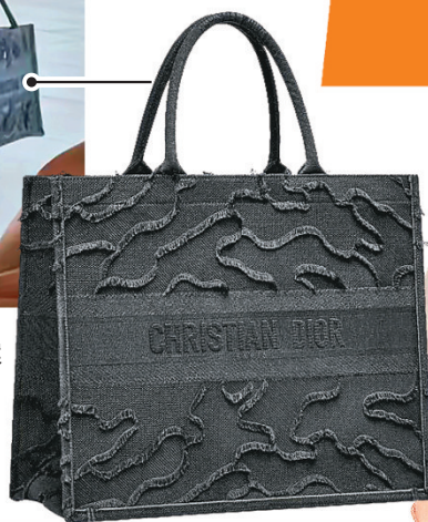
■ 黑色迷彩圖案 Dior Book Tote