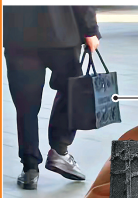
■ 方媛被搶的名貴包包。