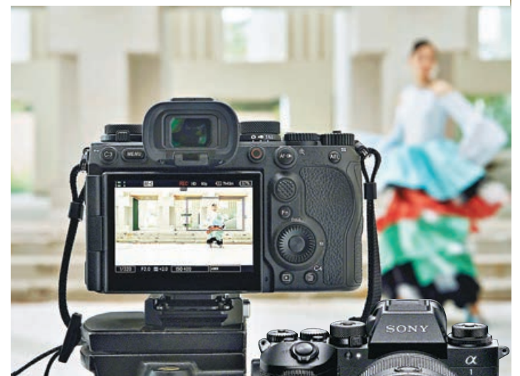
■相機能自動識別目標。

相機以外，OM System同步帶來高倍變焦長炮M.Zuiko Digital ED100-400mm F5.0-6.3 IS II（11,990元），最適合拍攝運動一類場景。