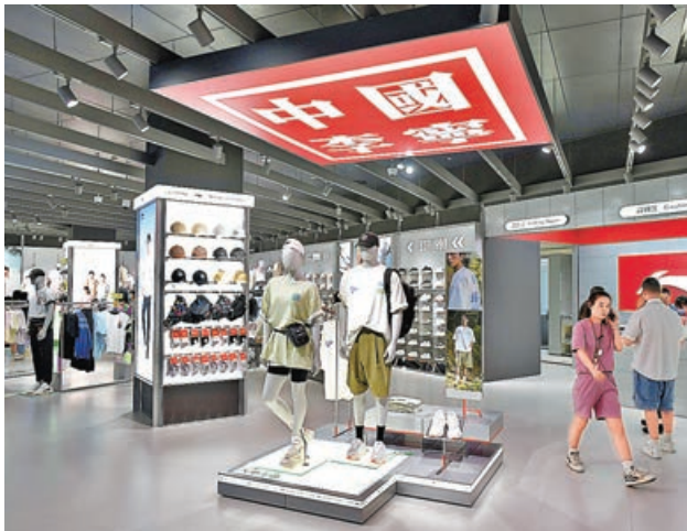
■ 近日持續拉升的內需消費回調壓力增。

港股上周五(7日)在盤中造出3年高位24,669點後持續回吐，隨着兩會行情逐步退出，投資者對政策面的預期有所降溫，引發市場回吐壓力增加。然而，從資金流向來看，港股市底仍處較堅穩的狀態，23,500點可以繼續看作為恒指目前初步支撐位，若能守穩的話，總體穩好格局料可保持。值得注意的是，北水流入港股積極性持續增強。港股通昨淨買入296.26億元，創單日淨流入金額新高。