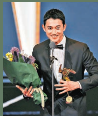
■吳健仁希望再來港拍電影。