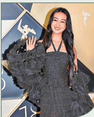
■光希奪亞洲飛躍演員獎。