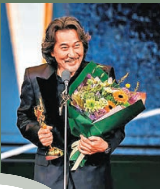
■役所廣司奪終身成就獎。