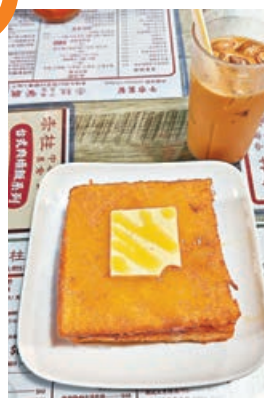
鹹蛋黃漏奶西多士。

餐廳菜式結合泰餐和港式茶餐廳特色，選擇豐富。比西多士更邪惡的是「鹹蛋黃漏奶西多士」，端上桌便香氣撲鼻，金黃酥脆的吐司切開瞬間，牛油煉奶如熔岩傾瀉，與鹹蛋黃夾心奶醬交融，鹹甜交織的濃郁口感讓人欲罷不能。