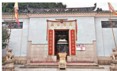
赤柱天后古廟已經有二百五十多年歷史。

赤柱天后古廟是香港南區歷史最悠久的一所天后廟，守護神「天后娘娘」（媽祖）坐鎮於此已逾二百五十年。廟宇整體佔地面積雖小，但規模卻不小，二進式的四合院設計包含前殿、正殿和廂房，中間還開有天井，頗有中國古建色彩，屋脊上的彩瓷雕龍與門前石獅盡顯嶺南工藝之美。廟旁古樹成蔭，香火與海風交融的氛圍，讓人心神不自覺沉靜下來。每逢農曆三月廿三天后誕，不少善信會專程前來參拜，香火鼎盛。