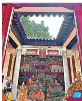
天后古廟屬二進式四合院設計。