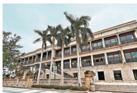
美利樓是全港少見的維多利亞式建築。牆與底層的圓拱形迴廊，搭配復古石柱，盡顯19世紀的西方古典優雅。午後斜陽穿透拱門，灑落幾何光影，是攝影迷最愛的天然布景。

想在香港尋一處「一秒穿越歐洲」的角落，美利樓絕對是首選。這座全港少見的維多利亞式建築擁有160年歷史，原址曾矗立於中環，後於上個世紀九十年代遷移至赤柱海濱，更添海風相伴的浪漫。灰白色花崗岩外牆與底層的圓拱形迴廊，搭配復古石柱，盡顯19世紀的西方古典優雅。午後斜陽穿透拱門，灑落幾何光影，是攝影迷最愛的天然布景。