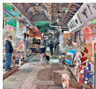
赤柱市集售賣各類手工藝品和紀念品。

這裏是赤柱最熱鬧的街道，也是許多外國遊客專程打卡的紀念品一條街。七彩棚頂下，各式小商舖販售着中國傳統刺繡、手繪瓷器、絲綢服飾等東方工藝品；同時陳列復古鐘錶、西洋油畫、印度手織地氈等異國商品，形成文化混搭的獨特風貌。市集原為赤柱漁民交易日常用品的聚落，現轉型為觀光熱點，遊客在此選購手信之餘，還能品味地道港式小吃。