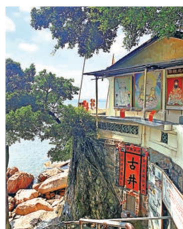
北帝古廟俯瞰赤柱灣全景。

隱身於赤柱灣西的礁石之上的北帝古廟，建於1805年，站在廟前可以俯瞰赤柱灣全景。廟內一口被鐵網封存的「千年古井」最引人遐想——當地人說井水曾能治病，如今雖已乾涸，但斑駁石壁與神秘傳說仍吸引探秘者駐足。