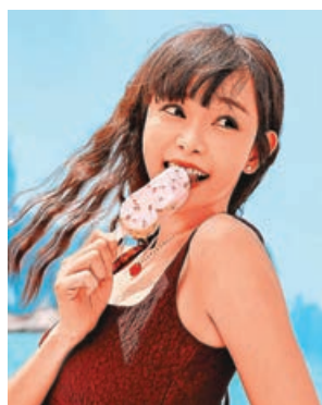
■Aka食雪條食得津津有味。