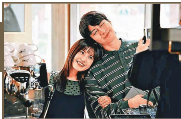
■坤哥新歌MV找來台灣網紅做女主角。