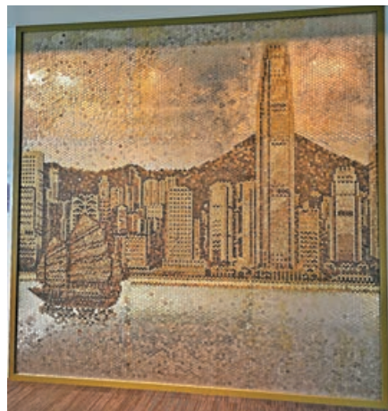
■硬幣堆砌的維港景色。

金管局諮詢中心除了可以在高樓俯瞰維港景色外，更有常設展覽供遊客免費參觀及學習知識。展覽館主要介紹金管局的工作和香港貨幣及銀行的發展，分為三大部分：「政策」展區闡述金管局的工作，並介紹相關的金融概念；「貨幣」展區全面介紹香港貨幣的設計、防偽特徵、製作過程和其他趣味知識，並展出香港現時流通的鈔票和硬幣；「歷史長廊」以1842年香港開埠初期為起點，細訴過去百年來香港的貨幣、金融和銀行發展史，並回顧金管局工作的里程碑。場內最特別的是一幅以各種面值的