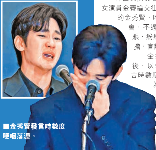
■金秀賢發言時數度哽咽落淚。

韓國男演員金秀賢被爆出與已故女演員金賽綸交往等糾紛，神隱21日的金秀賢，昨午在首爾舉行記者會，不過大多數網民並不賣賬，紛紛譴責金秀賢有欠承擔，言語「粉飾太平」。