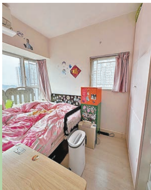
■主人房寬敞，可放置直身大衣櫃。

天水圍私人住宅栢慧豪園共有2期8座物業，合共提供2,960個單位。屋苑共分兩期，第一期名為栢慧豪園，共有5座物業；第二期名為栢慧豪庭，設有3座物業。屋苑單位的實用面積由455至832平方呎。屋苑位於天水圍市中心，鄰近巴士總站及輕鐵天榮站，交通便利。附近亦有大型商場，生活配套齊備。