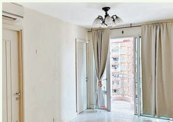
■弧形小露台很別致。