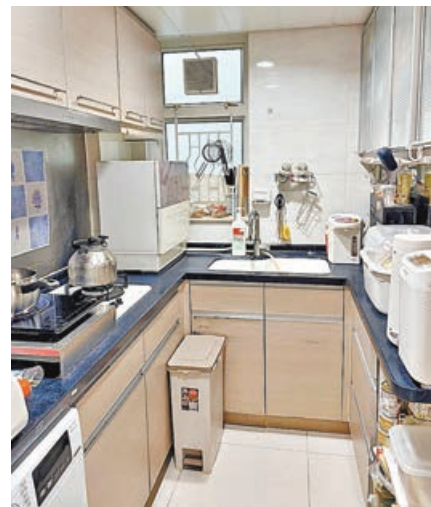
■廚房不算大，但五臟俱全。