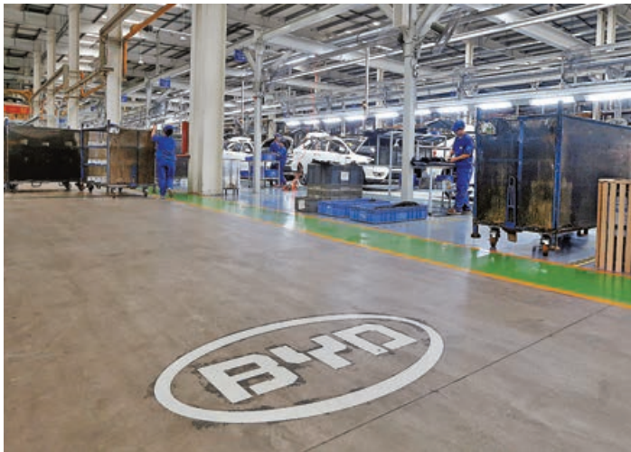
■市場憧憬國產電動車出口歐洲關稅問題有望解決，相關股份受捧。

港股四連升，恒指上周五（11日）再漲逾230點，以20,900點水平收盤，雖然外圍市場劇烈波動仍未過去，但從近日港股的表現觀察，不難發現還是保持相對較強抗跌力。事實上，美元相關資產（包括美股、美債及美元）整體受壓，是引發全球股市骨牌式下跌的源頭，環球資金爭相避險去槓桿，構成目前互相踐踏的情況。由於外資早前持港股佔比低，即使外資沽貨對港股影響亦相對輕微。