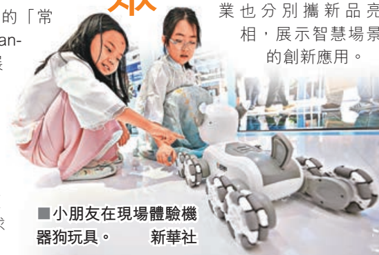
■小朋友在現場體驗機器狗玩具。

此外，華為、科大訊飛、韶音等全球消費電子與前沿科技領域的頭部企業也分別攜新品亮相，展示智慧場景的創新應用。