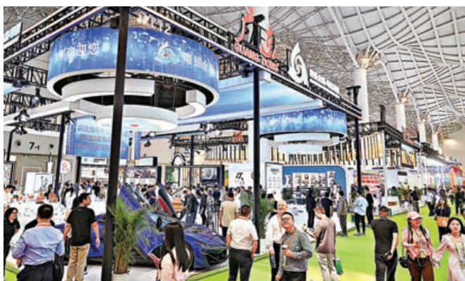
■消博會國貨特色潮品展區。

第五屆中國國際消費品博覽會(簡稱「消博會」)、「購在中國」系列活動啟動儀式13日上午在海南省海口舉行。本屆消博會是今年中國舉辦的首場重大國際性展會，也是中國唯一以消費為主題的國家級展會。本屆消博會以「共享開放機遇，共創美好生活」為主題，共迎來71個國家和地區的1,700餘家消費企業、4,100餘個消費品牌參展，涵蓋時尚、健康、科技、服務等眾多領域消費新品與精品。法國、瑞士、愛爾蘭等國家繼續組織優質消費企業和產品參展，斯洛伐克等國家則首次組團參展，國際消費精品新品進一步集聚。