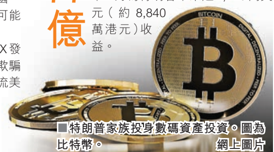
■特朗普家族投身數碼資產投資。圖為比特幣。

彭博社指出, 在去年9月即美國總統選舉開始前不久, 特朗普家族宣布推出加密幣計劃「世界自由金融」(WLF), 該項目自成立以來一直購買以太幣、波場幣等加密幣, 特朗普家族控制的一間公司擁有WLF的60%股權, 文件顯示與特朗普有關的公司可獲得淨收入75%。在上月完成第二輪代幣銷售後, WLF已在代幣銷售中籌集5.5億美元 (約42.6億港元)。另外, 在特朗普1月正式就任總統前數天, 他和妻子梅拉尼婭又先後推出個人迷因幣。迷因幣1月為特朗普帶來逾1,140萬美元 (約8,840萬港元) 收益。