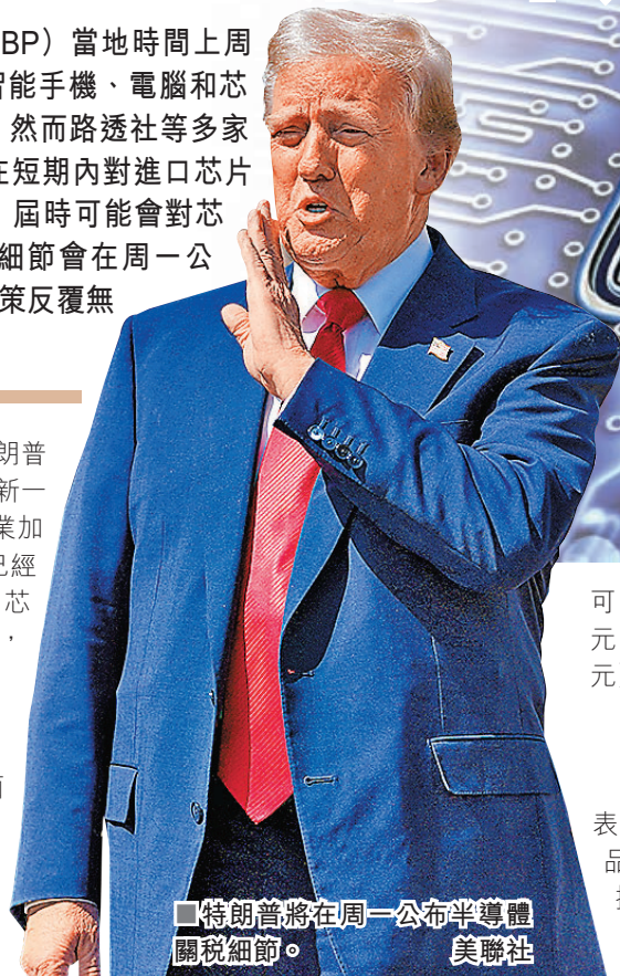
■特朗普將在周一公布半導體關稅細節。

CBP在指引列出20項條目, 只要屬於這20項的產品, 包括智能手機、硬盤、電腦處理器、內存芯片及一些半導體製造設備, 追溯至美東時間4月5日凌晨12時01分起, 報關時將豁免對等關稅。美國智庫蘭德公司高級研究員迪皮波表示, 美國海關的資料顯示, 這些豁免對等關稅的產品, 佔中國銷美貨物比重達20%以上。媒體指出, 這顯示特朗普政府逐漸意識到, 關稅將對憂慮通脹的消費者帶來痛苦。