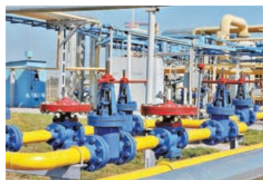
■美國圖將俄羅斯天然氣管道納入礦產協議。圖為天然氣管道。

另一方面, 美國繼續向俄羅斯施壓, 要求俄方採取行動解決俄烏衝突, 期望盡快落實俄烏停火協議。美國總統特朗普周日表示, 他認為對話可能會有進展, 「我認為俄烏之間可能進展順利, 你們很快就會知道。」特朗普同日簽署一項行政命令, 延續美國對俄羅斯的國家緊急狀態一年, 代表著美國對俄的部分制裁措施延長一年。