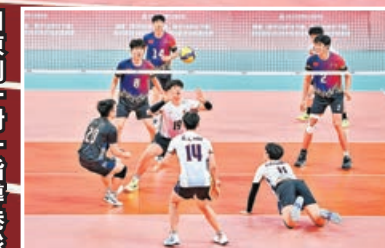
■港將普遍熱愛排球。