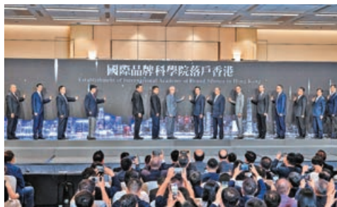
■香港首屆世界品牌大會昨於會展舉行。

面對日益複雜的國際形勢，掌握自主的品牌檢測、認證體系和知識產權保護機制至關重要。香港首屆世界品牌大會及國際品牌科學院落戶香港儀式昨日在會展中心舉行。行政長官李家超致辭時表示，香港可以服務更多內地品牌走向全球，為品牌強國建設作出貢獻。同時，特區政府將積極維護香港健全有效的保護知識產權制度，打造香港成為區域知識產權貿易中心，為內地和海外品牌交易提供更好的監管環境。