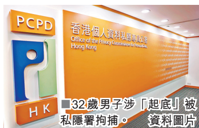
32歲男子涉「起底」被私隱署拘捕。資料圖片