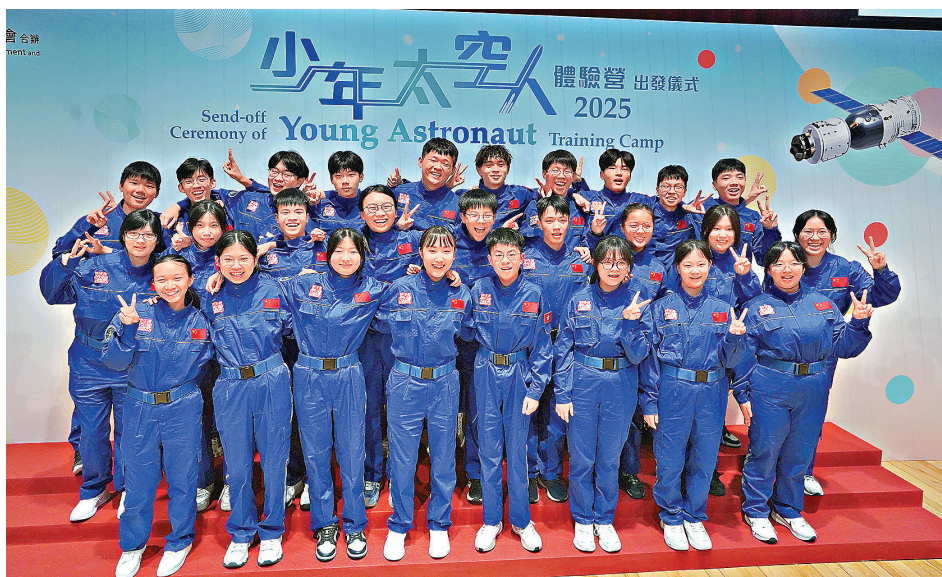
獲選的30名少年太空人表現興奮。