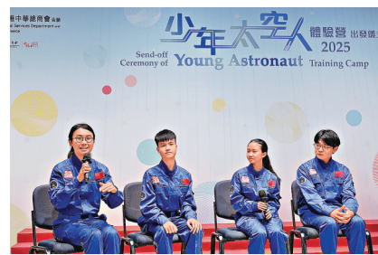
少年太空人分享對體驗營的期望。資料圖片

政務司副司長卓永興寄語學生們要把握受訓機會，感受國家航天事業輝煌成就，將來成為推動國家航天事業發展的寶貴力量。