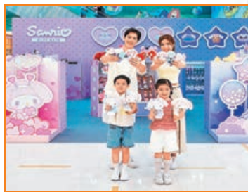
活動期間更設有主題限定店。