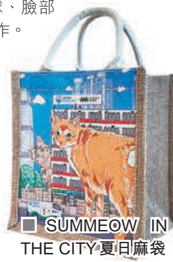
SUMMEOW IN THE CITY夏日麻袋