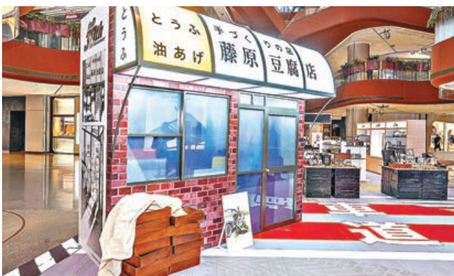
完美復刻藤原豆腐店的鋪面。

和「Initial D 30th Anniversary」字樣，輕巧便攜，讓你在炎炎夏日感受秋名山的涼風。所有商品均採用限定包裝，粉絲務必把握機會收藏。