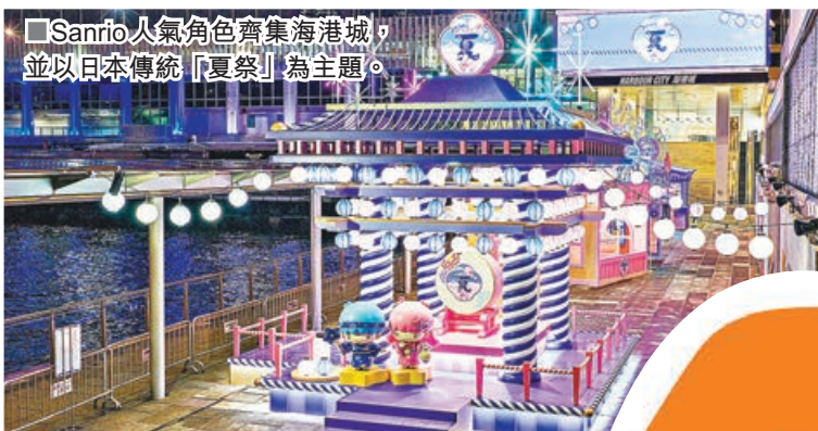
Sanrio人氣角色齊集海港城，並以日本傳統「夏祭」為主題。