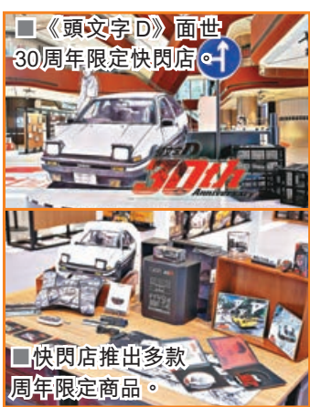
《頭文字D》面世30周年限定快閃店。

為慶祝經典賽車漫畫《頭文字D》面世30周年，限定快閃店將於即日起至8月28日暑假期間強勢登陸啟德AIRSIDE。今次限定快閃店精心設計了多個拍照打卡區，入口可見藤原拓海倚着愛驅AE86，車迷可盡情與「秋名山車神」合照；另一邊則完美復刻藤原豆腐店的鋪面，瞬間勾起漫畫中拓海凌晨送豆腐的回憶。同樣引人注目的還有作品介绍展版及原畫複製品展示。快閃店推出多款30周年限定商品，兼顧實用性與收藏價值。賽車迷必入的汽車香薰，以經典RX-7Vs NSX山路對決為設計藍本，可放置在車內或辦公桌。夏日必備的手提風扇出風口採用測速儀設計，下方印有「AE86」