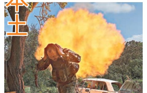
■傳美限制烏軍使用遠程導彈襲俄。圖為頓巴斯烏軍向俄軍陣地發炮。

分析認為國防部的暗中限制，實際上推翻了美國前總統拜登任內頒布、允許烏軍使用ATACMS襲擊俄境內目標的決定。特朗普日前在社媒上揚言，烏克蘭需主動進攻，否則不可能擊敗俄。但美國官員私下坦言，特朗普的聲明並不意味美方會改變政策，美方不會取消審查機制，也不會鼓勵烏軍使用ATACMS等西方研製的遠程導彈。