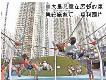
大量兒童在屋邨的康樂設施遊玩。資料圖片

香港房委會自1998年起推出「租者置其屋計劃」（租置計劃），讓租戶可用低廉價錢購買其租住單位，至今已涵蓋39條租置屋邨，成功售出逾14萬個單位。民建聯昨日發表的調查顯示，97%受訪九龍東公屋租戶有意購買其租住單位，個別屋邨甚至接近90%受訪者表明「一定會買」。民建聯指出，租置計劃既可協助基層居民累積資產，實現置業夢想及縮窄貧富差距，同時亦可釋放土地價值，減輕政府財政負擔，建議重推計劃並提出升級版「租置2.0」，讓現有租戶透過可負擔的價格購買原居單位，料可惠及全港約80萬個公屋家庭。