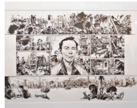
■ 《SpyGames 2》以香港為創作背景。

加活動的工作證，以及逝世前一日在球場表演時所穿的球衣，可謂為展覽畫了一個既深情又充滿生命力的句號，彷彿提醒觀眾：藝術家的靈魂從未離開，他的線條仍在紙張與記憶中自由延展，永無終結。