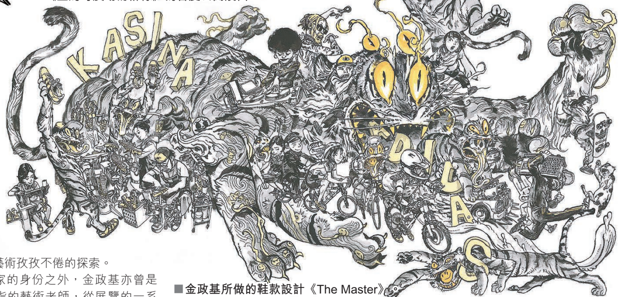
■ 金政基所做的鞋款設計《The Master》

作為「動漫藝術節 2025」的壓軸巨獻，國際級韓國藝術家金政基（Kim Jung-Gi）的大型回顧展「金政基：無盡線條之旅」正於香港藝術中心持續掀起觀展熱潮。這場展覽不僅延續金政基自由奔放的創作靈魂，更以逾 200 件珍貴展品帶領觀眾深入這位「速寫之神」的奇幻藝術宇宙——從早期或細膩或隨性的漫畫原稿，到巨幅即興創作與跨界合作項目，每一筆觸都彷彿在訴說着他無稿成畫的傳奇。