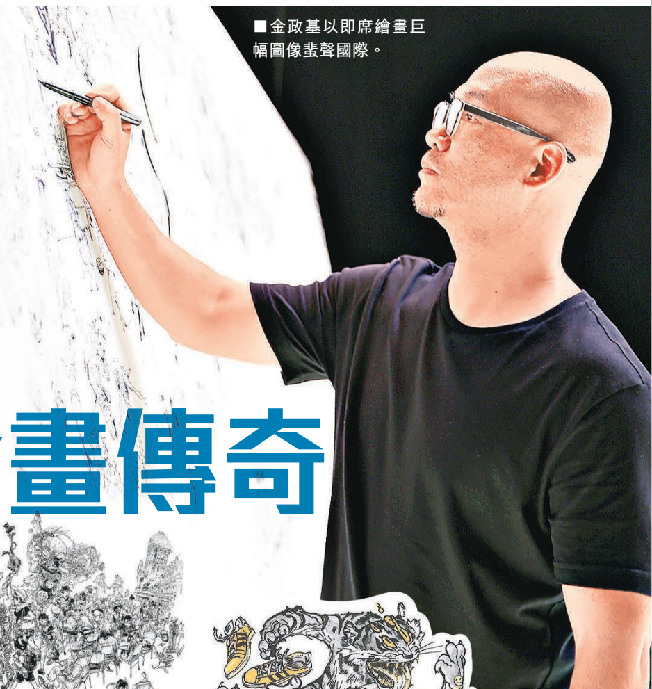
■ 金政基以即席繪畫巨幅圖像蜚聲國際。