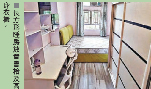
長方形睡房放置書枱及高身衣櫃。