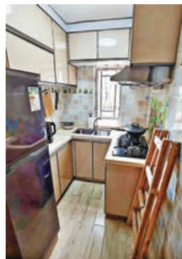
廚房牆身鋪上瓷磚。