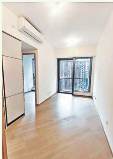
長方形大廳直達露台。