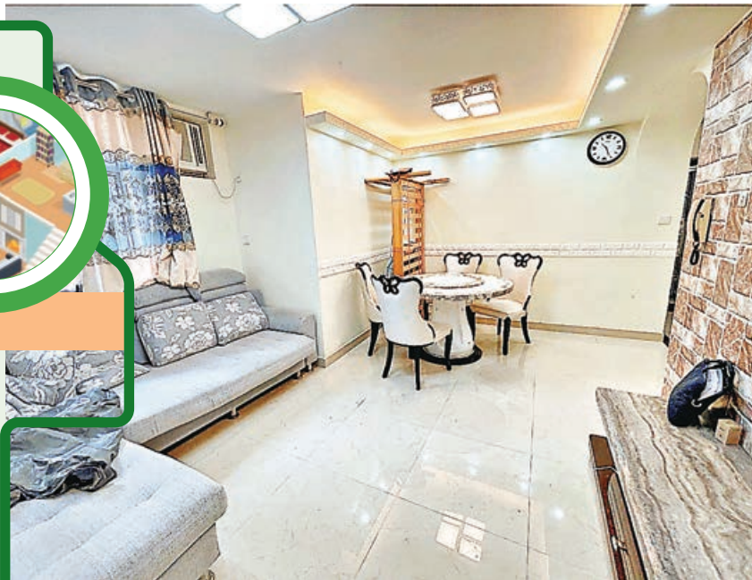
鑽石形大廳可擺放大型傢俬。