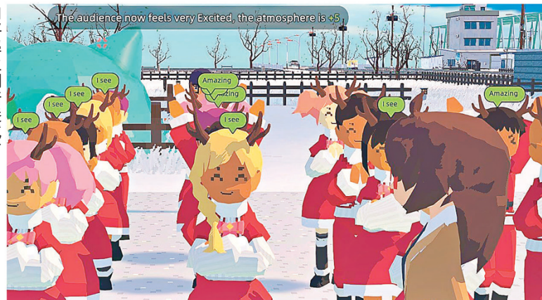
■心情值會影響學生的積極性。

生編排特色課程，兼顧學生心情和學習質量，引領他們走上各種各樣的人生道路，同時也是獲取辦學資金和推進遊戲進度的重要方式。遊戲售價125元，快來打造你夢想中的校園吧。