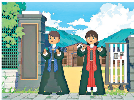
■將學生們培養成才。

玩家可以擴建學校區域，發展出功能各異的建築，學校的娛樂設施體量會影響學生的心情，心情不好就會喪失學習積極性，食堂修多了學生就會長胖，學習壓力大就會戴上眼鏡等。以及自由招募師生，讓教師不斷進修以適應更多的崗位，為學