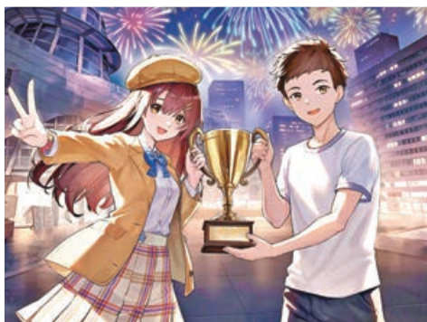
■結識性格各異的同學。