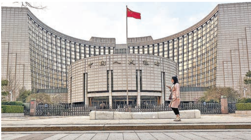
■分析預期，未來央行增持黃金仍是大方向。

得益於美元下挫帶來估值提升效應。今年8月底，中國外匯儲備升至33,222億美元，較7月底增加299億美元，創2016年1月以來新高。專家指，今年以來，國家外匯儲備累增1,198億美元，達近10年高位，加上人民幣匯率同步走強，外匯市場向好，顯示中國防範化解外部衝擊能力持續提升。此外，數據顯示，儲備結構繼續優化，人民銀行連續10個月增持黃金儲備，上月淨增持6萬盎司，黃金儲備佔同期外匯儲備餘額比重亦升至7.64%，創歷史新高，但仍低於國際平均水平。