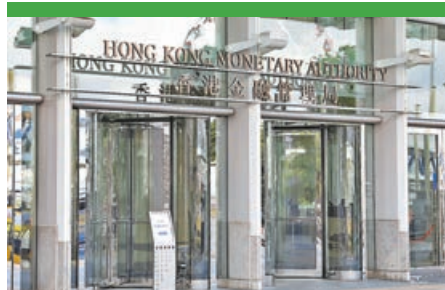
■金管局下一步擬納入重工業。 中通社

此外，新世界(0017)夥遠東發展(0035)發展的啟德柏蔚森周六日共售出4伙，套現3,077.2萬元。