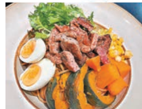
■肉眼牛排多彩能量碗營養豐富亦夠飽肚。

影完相打完卡當然要醫肚，商場B2層的西餐廳「艾特九牛·原切雪花牛排館」創立於2016年，是品牌首店，開業至今吸引不少附近街坊及港客捧場。店家裝修寬敞明亮，以性價比取勝，今年初曾受中央電視台訪問，所有牛排也是源自烏拉圭農場，主打高品質原汁原味的原切牛排，擺脫傳統牛排醃製模式，菜品全部也是即叫即煮，店家承諾不做合成肉，開放式廚房令食客吃得放心，同時兼顧美味與健康。各位港客於大眾點評團購約¥49.9的工作餐，提供多款選擇，當中「地中海黑椒肉眼牛排多彩能量碗」賣相不俗，肉眼牛排切粒上，嫩滑多汁具咬口，分量不少，配菜包括焗蛋、南瓜、粟米粒、紅蘿蔔等健康天然美食，底層主食可選意粉或飯，肯定夠飽。