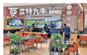
■餐廳裝修具空間感，加上開放式廚房令食客安心。