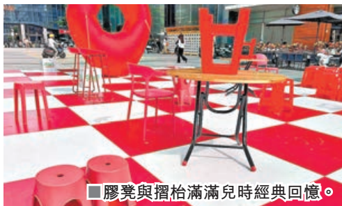
■膠凳與摺枱滿滿兒時經典回憶。

早前，遊客關注商場小紅書及拍攝快閃店照片兼在個人小紅書發布，可免費換領一杯特調益力多，總共送出了999杯。至於商場各大門口亦有「9要出來」的宣傳海報及字句，商場高層外圍更有一把「9要出來」巨型吹氣扇及紅色膠凳。值得一提，L1層北廣場室外街區出自國潮設計師之手的「國美省凳藝術展」也值得朝聖，「省凳一條街」在如同紅白色圍棋棋盤的位置，擺放不同款式的紅色膠凳，例如圓凳、四方矮凳等，亦有摺枱，滿滿廣東街頭文化色彩，商場以廣式烏托邦形容該展覽，適合喜歡懷舊的港客前來。