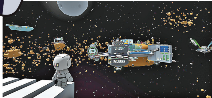
■全新免費更新「衝向宇宙」。

此外，透過此次全新免費更新「衝向宇宙」，玩家可以一起登上宇宙，享受比以往規模大兩倍的豐富內容，包括更多可探的任務、工作及交通工具等。在玩家習慣太空地圖前，需要在全新改造的晃晃太空中心完成訓練，取得飛往宇宙的資格，之後即可踏上充滿新玩法與冒險的浩瀚旅程。遊戲正於 Steam 平台展開八折促銷，僅售 124.8 元，截至 9 月 30 日。