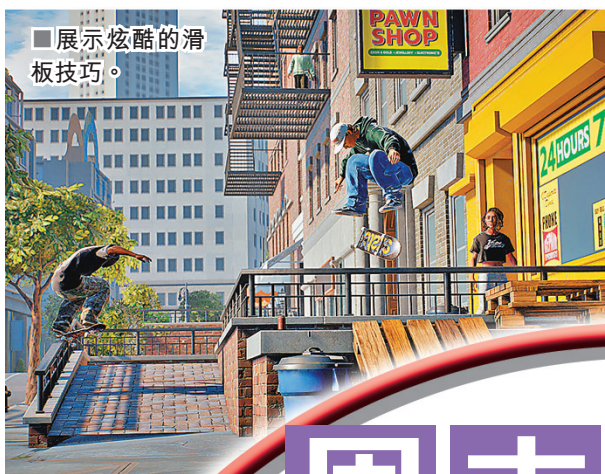
■展示炫酷的滑板技巧。