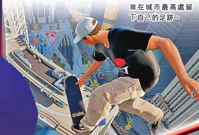
■在城市最高處留下自己的足跡。