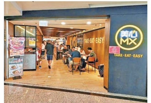
■美心MX盆菜特地為Eatizen美心薈會員提供五三折快閃價。

不過，屯門凝香居負責人表示，今年中秋盆菜沒有加價，但暫時不覺生意受到經濟差帶來大影響，估計今年中秋盆菜生意按年增加一成以上。至於客人每張訂單平均1至2盆。