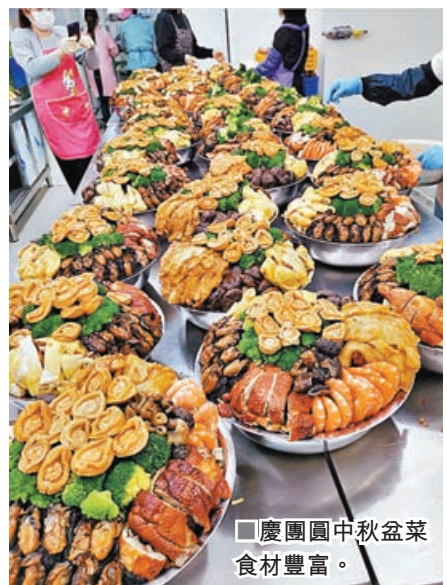
■慶團圓中秋盆菜食材豐富。

四喜鮑魚盆菜，鮑魚福聚盆菜和豐盛團聚盆菜，折後售價分別為518元，718元和668元。