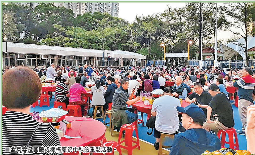
■盆菜宴是團體或機構慶祝中秋的重點活動。