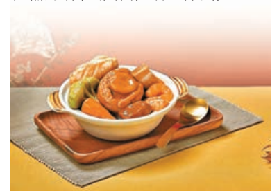
■大家樂推精裝盆菜（軟餐·一人分量）。

另外，即日起，凡購買大家樂「食得樂」輕嚥料理便當，即可享以38元（標準價48元）加購大家樂中秋輕嚥月餅（蛋黃白蓮蓉1件裝）。