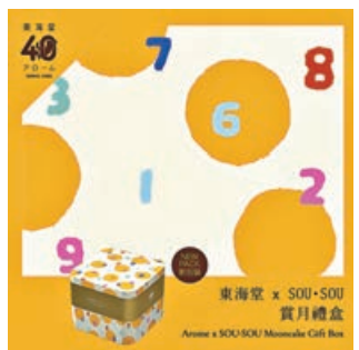
■東海堂今年推創意中秋月餅雙層禮盒。

中秋月餅現貨開始換領，各大月餅商繼續優惠促銷。如美心月餅今年的中秋月餅限時優惠實行買2送1。於美心網店購買2張指定美心流心系列月餅實體禮券或電子禮券，即送「美心冰皮二人世界禮包」一件。