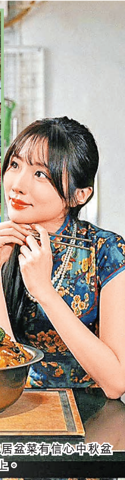
■屯門紅橋凝香居盆菜有信心中秋盆菜生意升一成以上。

中秋節將至，今年中秋盆菜銷售反應未如預期，綜合盆菜商表示，雖然經濟穩步復甦中，惟市民消費意慾低下，今年盆菜生意額料與去年同期持平。而今年盆菜沒有加價外，個別更推出快閃價優惠，盆菜售價低至五三折。