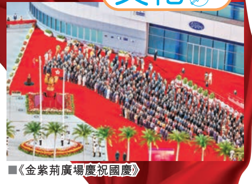
■《金紫荊廣場慶祝國慶》

作品《金紫荊廣場慶祝國慶》，展現金紫荊廣場國慶升旗儀式上，逾200名社會賢達肅立觀禮。團隊利用科技呈現紀律部隊海陸空總動員賀國慶的盛況，飛行服務隊直升機飛越維港上空，攜旗空中敬禮，而水警輪則隨碧波浮動，作海上敬禮，場面逼真生動。陸上儀仗隊以中式步操進場，進行升旗儀式。國歌響起，一同見證國旗冉冉上升的莊嚴時刻。